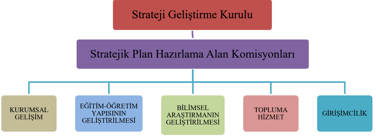
Şekil 1: Stratejik Planlama Çalışmaları Organizasyonu